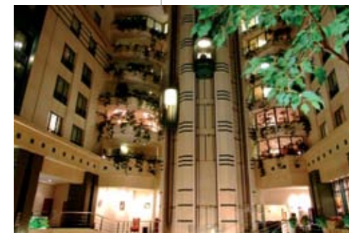
Vpravo uprostřed – Radisson Blue Royal Hotel – luxus ve stylu art deco