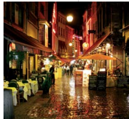
Nahoře vlevo – Kulinářský ráj na Rue des Bouchers

Brusel nabízí okolo stovky tanečních parketů. Jen namátkou je to například Le Fuse na Rue Blaes 208 ( www.fuse.be ) – klub pro milovníky techna, housu a junglu. Dále je tu Bazaar na Rue des Capucins 63 ( www.bazaarresto.be )