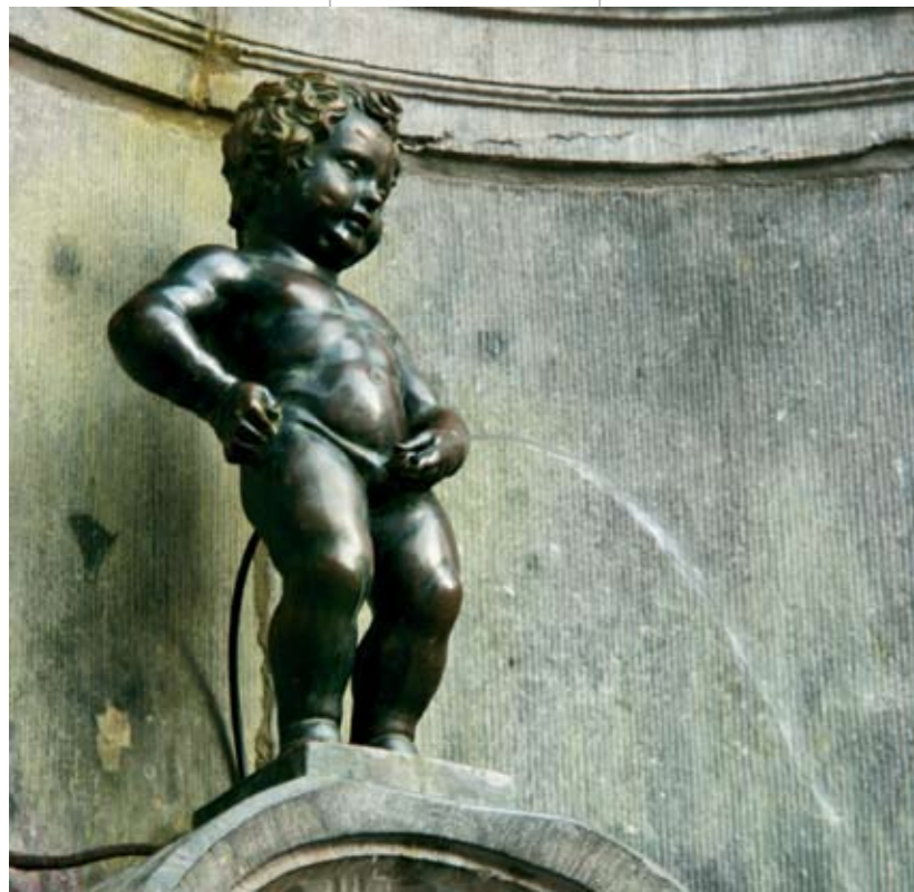
Sochu čurajícího chlapečka nemůžete při své návštěvě vynechat