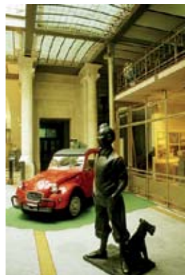
Postavičky a jejich svérázný svět v Muzeu komiksů

nejzajímavější z vystavovaných předmětů jsou prototypové nástroje Adolpha Saxe, belgického vynálezce saxofonu. Muzeum najdete nedaleko nádraží Central na adrese Montagne de la Cour Hofberg 2. Vstupné se pohybuje okolo 5 eur.