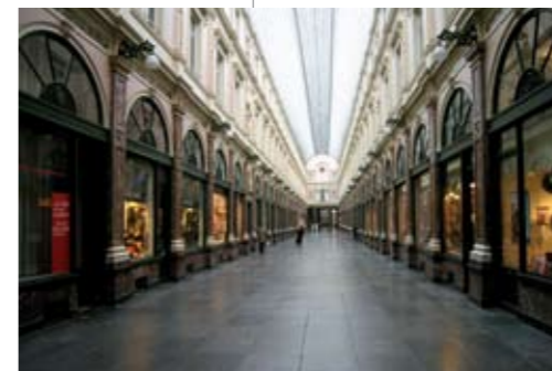
Vlevo uprostřed – Královské galerie sv. Huberta se svou unikátní prosklenou střešou